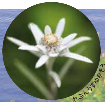
れぶんすゆきそう