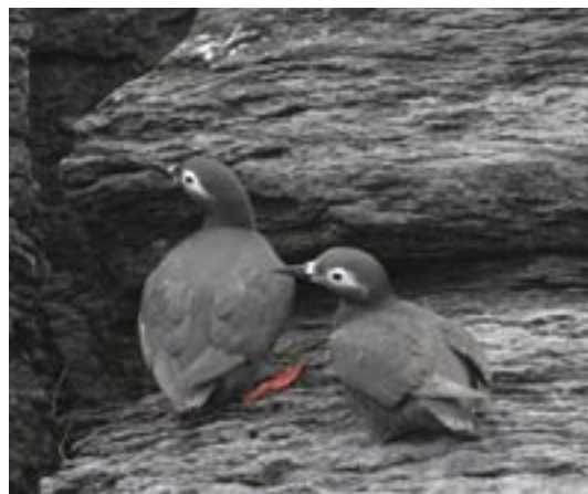
図7. ケイマフリ Cepphus carbo のコロニー (岩尾別周辺, Jul. 9, 2004).