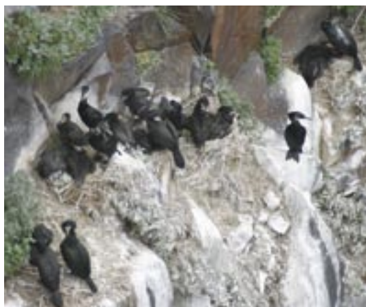
図5. ウミウ Phalacrocorax capillatus のコロニー (フレベ, Jun. 28, 2003).

の巣には雛や卵が残っていなかった。何者かに捕食された卵や雛の死体が残存する巣もあり、コロニーは壊滅的状况であった(図3, 4)。三角岩はウトロ港と陸続きでありノネコやキツネなどの捕食者が容易に侵入できる場所である。今後、ウミ