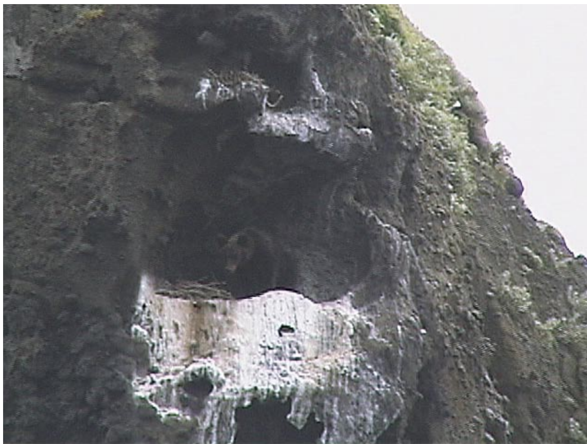
図6. ウミウ Phalacrocorax capillatus のコロニーに侵入するヒグマ (蛸岩の対岸, Jul. 19, 2002).