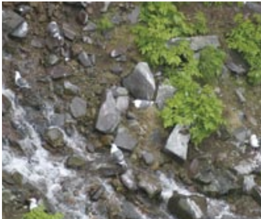
図2. オオセグロカモメ Larus schistisagus のコロニー (フレベ, Jun. 28, 2003).