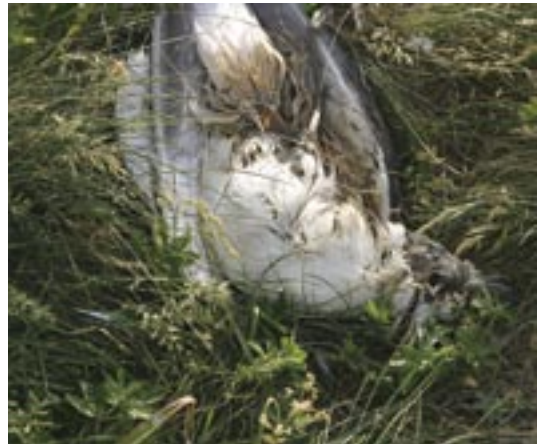
図3. 2004年6月26日にみられた三角岩のウミネコ Larus crassirostris コロニーにおける何者かの捕食者による被害。

1997年から2004年までの調査結果を表1に示す。本種は知床半島で最も多く繁殖している海鳥である(図1)。この鳥の最大の繁殖地は斜里町側フレベの滝で2004年には472巣であった。2004年の営巣総数は2003年と比較して121巣が増加し、特に羅臼側の眼鏡岩周辺で目立って増加した。また、斜里町側のタキノ川の北で新たに12巣の営巣地ができた。2001年以降F域で減少しているのはカパールワタラでの営巣数が減少しているからである。