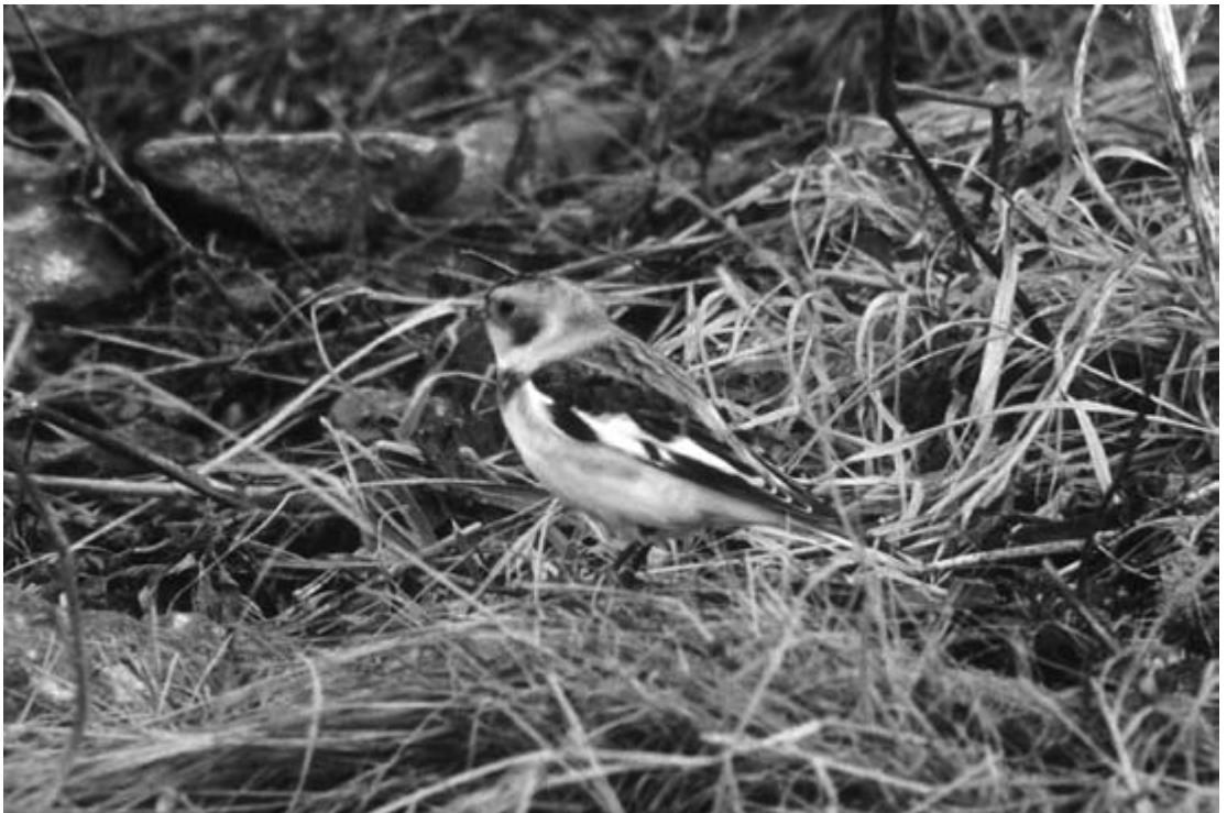
図3. ユキホオジロ. 2003年11月3日, ルシヤ.