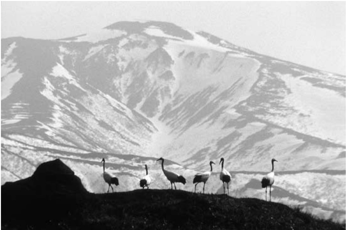
図2. タンチョウ. 2008年4月26日, 知床五湖の一湖(後ろの山は知西別岳). 成鳥4羽と若鳥2羽が飛来. 12時10分頃, 西側湖岸のヨシ群落に離れて3羽. 12時45分, 知床岬方向より3羽が一湖の西側丘陵地に飛来し, ヨシ群落の3羽が合流. 13時55分, 6羽が五湖の断崖を越えオホーツク海上に飛び去った.