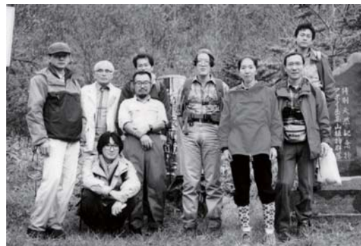
1995 年度巡検(アポイ岳)